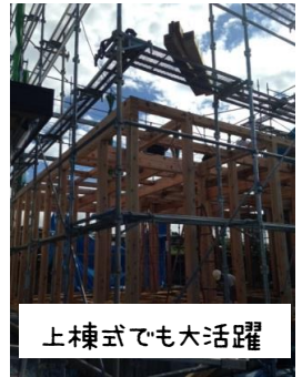
上棟式でも大活躍