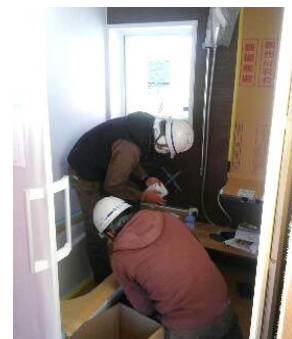
ユニットバス工事