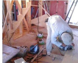
階段を加工する大工さん