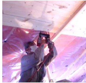
天井の板を張る大工さん

今月は、様邸の天井仕上げ工事、階段工事、通気胴縁工事、ユニットバス工事です。 まず、天井仕上げ工事。こちらは2階の天井を仕上げているところです。様邸の屋根は勾配天井といって、屋根の傾きのまま仕上げていくのですが、首が大変なことになります(笑)大工さんも辛そうです。 続いて、階段工事。今回は、現場にて大工さんに親板という部材を加工してもらっています。様邸の階段は少し宙に浮いているようなイメージで、大工さんとも下地の位置について「この幅がいいだろう」「いや、この幅で」などと意見を現場でぶつけ合い!!こういう時が、楽しい自分。大工さんの意見も取り入れながら階段を仕上げていきました。 通気胴縁も、階段工事をしてくれた大工さんが行ってくれました。 通気胴縁とは、外壁材の下地でなおかつ空気も動かして断熱材を守るとっても大事な工事。今回は仕上げ材が縦なので下地は逆に横になり、やや難しくなります。ですが、大工さんはテキパキと行ってくれました。 最後に、ユニットバス工事。今回も、TOTO社さんのユニットバス。今回は、二人組で行ってくれました。床下からの空気が回らないように丁寧に気流止めをしてくれました。 窓の位置が難しく設置場所を悩んでいましたが、自分に「ここは、こちら側によって大丈夫ですか?」「床の取合いは大丈夫ですか?」など丁寧に質問してくれる職人さん達。注意点をこちらから伝えて、無事完成しました。