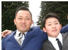
帰宅して、長男と記念写真