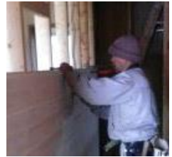
間仕切りの壁に板を貼っています。