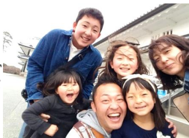
金沢城、二の丸広場にて家族写真

先日、初めての卒業旅行に行ってきました。長男も中学校に入学し、これから先家族をろって出掛ける事も少なくなると聞いていたので、ずと前から卒業旅行に行きたいと思っていました。6年生になった時、「卒業旅行に行くのなら、どこがいい？」と聞くと、「ユニバーサルスタジオ、沖縄、鎌倉」と言っていたのですが11月に旅行会社へ行く直前、「金沢に行きたい!」と。「えっ? 金沢」と思いつつも、申し込みすると、担当になってくれたあま市さんが、「えっ? 卒業旅行で金沢。大人な六年生ですね。」と言われ...確かに金沢とは思いつかず。でも大人も楽しめそう。さ、そく計画を立て、卒業、入学でバタバタ中、行ってきました。一番の思い出は長男が3回も迷子になった事(笑) 1日2万歩ちかく歩いて、歴史にふれ、美味しい物を食べて良い思い出が出来ました。これで最後の卒業旅行だよと言っていたら、長女が、富岡のユニセフパークでいいから行ってほしいと今から言っています。