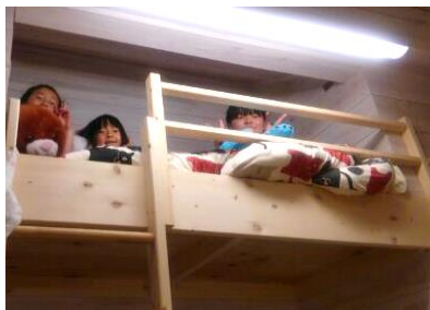
H様邸ロフト式ベッド