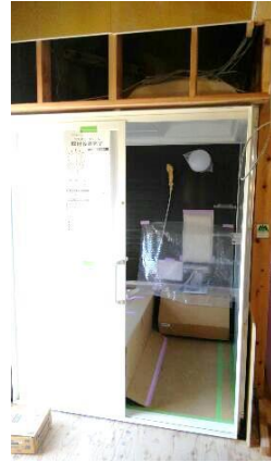
ユニットバス片引き戸の入り

色々難しい部分もありましたが、大工さんたちのやり終えた後の満足そうな顔が印象的でした。