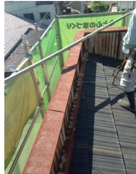
↑錆び付いた気になる個所