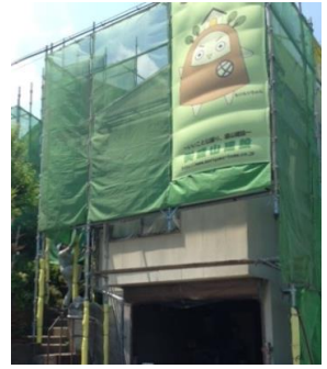
見えないですが、事務がよじ登ってます?!