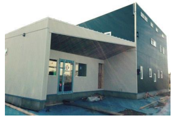
足場が外れました