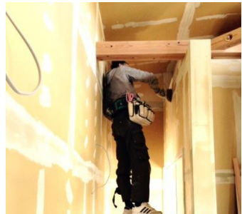
内装工事の下地工事中です