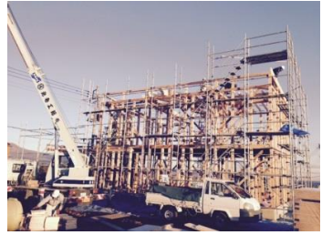
店舗兼住宅。大きいです。