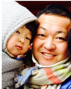
末娘と買前神社にて