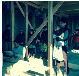
専務が祝詞を 読ませて頂きます