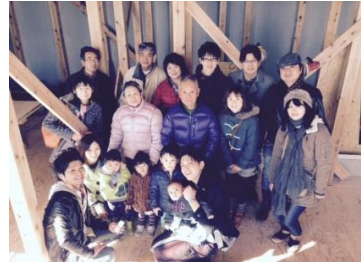
素敵なご親族様です