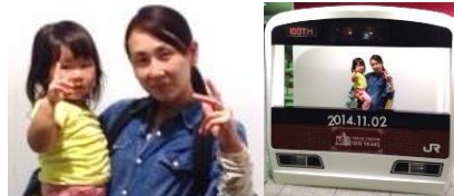
東京駅に記念写真ブースあり(笑) ピースがだいび押しになってきました^^

現場作業期間中に美味しいと聞いていたおやば屋さんも寄れて(娘は親子丼)大満足。奥様にはお会いできず残念でしたが娘さんにお渡しできて良かったです。おかげ様で、大好きな電車旅も出来て楽しかった近頃の家です。