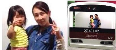
東京駅に記念写真ブースあり(笑) ピースがだいぶん少なくなってしまいました^^

現場作業期間中に美味しいと聞いていたおやば屋さんも寄れて(娘は親子丼)大満足。奥様にはお会いできず残念でしたが娘さんにお渡しできて良かったです。おかげ様で、大好きな電車旅も出来て楽しかった近頃の家です。