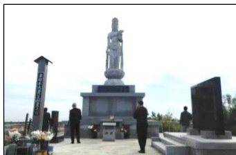
東日本大震災慰霊之塔

地元住民の方々にお話を聞かせて頂きましたが、そこに住む方々は海と共に今も生きている。盛土で囲み海の際に住ませたくない国と、海で生きている地元住民の方々の話がうまく言っていない印象を受けました。そして、「東北を忘れないで」と一言。日々に反省です。皆様もぜひ、足を運んで生の状況を確認して頂き、さらに東北の美味しい物を食べて、たくさん笑顔をお届けする事が大事なのかと思いました。